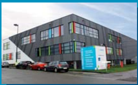
Site Mécatronique Rue Auguste Piccard 23 6041 Gosselies