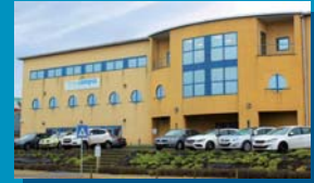
Site Usinage Avenue Georges Lemaître 22 6041 Gosselies