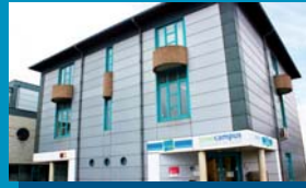
Site Maintenance Avenue Georges Lemaître 15 6041 Gosselies