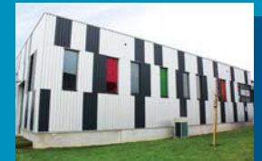
Site Plasturgie Rue Auguste Piccard 26 6041 Gosselies