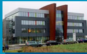
Siège Social Rue Auguste Piccard 20 6041 Gosselies