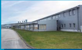
Site Assemblage Quai du Pont Canal 5 7110 Strépy-bracquegnies