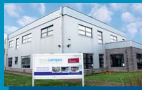
Site Miniusines Boulevard Initialis 18 7000 Mons