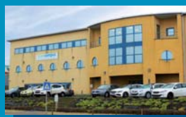
Gosselies 2 Avenue G. Lemaître 22 6041 Gosselies 071/250 350