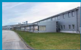
Strépy Quai du Pont Canal 5 7110 Strépy 064/312 072