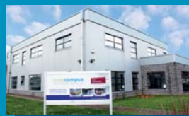
Mons Boulevard Initialis 18 7000 Mons 065/401 212