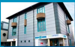
Gosselies 1 Avenue G. Lemaître 15 6041 Gosselies 071/253 634