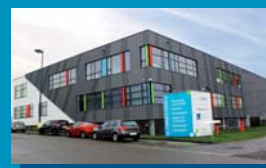
Gosselies 3 Rue Auguste Piccard 23 6041 Gosselies 071/378 052